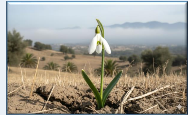
Antalya Kardeleni ( Galanthus elwesii var. monostictus )