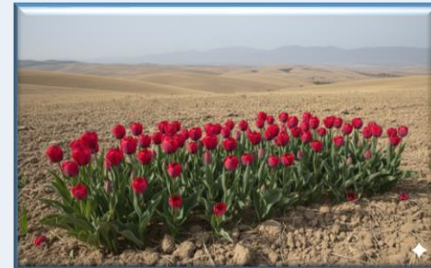
Konya Lalesi ( Tulipa konyalensis )