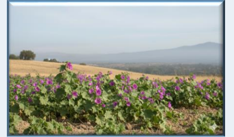
Ebe Gümece ( Malva sylvestris subsp. mauritiana )