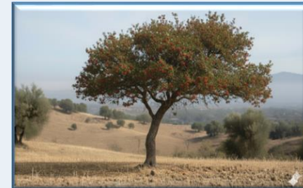
Herdemyeşil Alic ( Crataegus davisi )