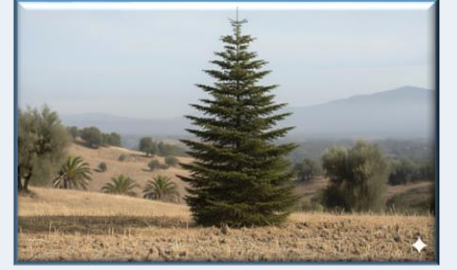
Kazdağı Göknarı ( Abies nordmanniana equi-trojani )