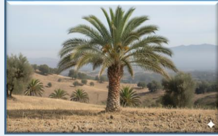
Datça Hurması ( Phoenix theophrasti )