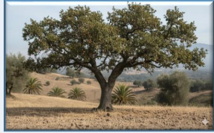
İspir Meşesi ( Quercus macranthera )