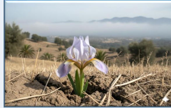
Antalya İrisi ( Iris antalyensis )