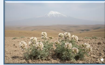
Ağrı Dağı Otu ( Astragalus karsianus )