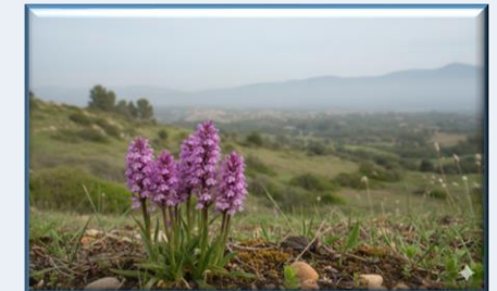
Lıkyalı Orkidesi ( Dactylorhiza osmanica subsp. osmanica )