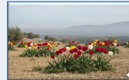
İzmir Lalesi ( Tulipa izmirensis )