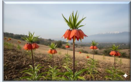
Van Ters Lalesi ( Fritillaria imperialis )