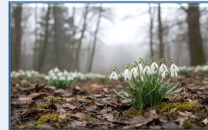
Gala Çiçeği ( Galanthus plicatus )