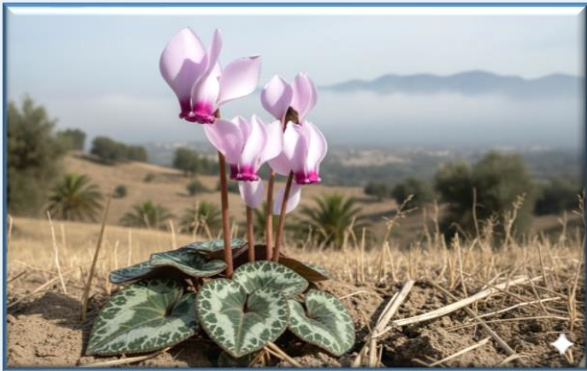
Siklamen ( Cyclamen mirabile )