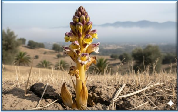
Side Canavar Otu ( Orobanche sideana )