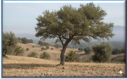
Kasnak Meşesi ( Quercus vulcanica )