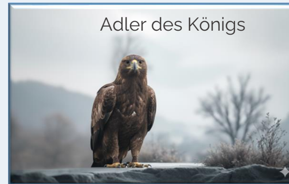
Adler des Königs

Der Königsadler ist eine majestätische, vom Aussterben bedrohte Greifvogelart, die in den östlichen und südöstlichen Regionen der Türkei lebt. Er fällt durch seine Größe und starke Struktur auf. Er lebt normalerweise in der Steppe und auf offenem Land, baut sein Nest in den Wipfeln großer Bäume.