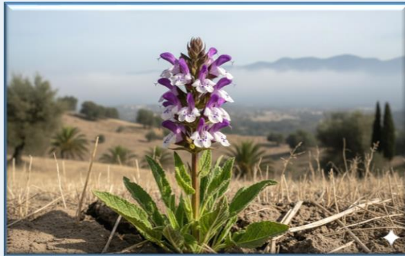
Antalya Adaçayı ( Salvia antalyensis )