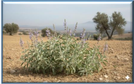
Anadolu Adıçayı ( Salvia anatolica )