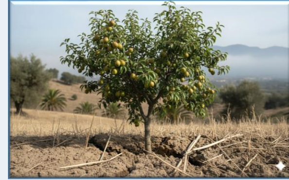
Serik Armudu ( Pyrus serikensis )