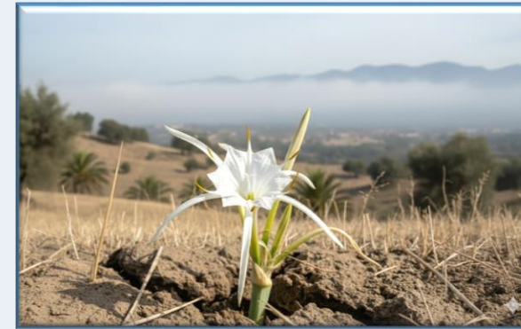
Kum Zambağı ( Pancratium Maritimum )