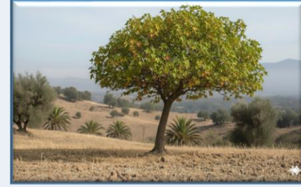
Sığla Ağacı ( Liquidambar orientalis )