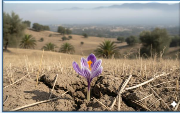
Asuman Çiğdemi ( Crocus asumaniae )