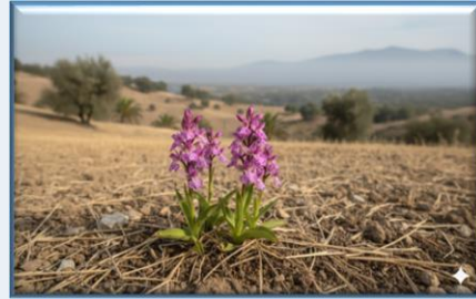
Anadolu Orkidesi ( Orchis anatolica )