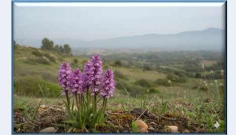
Lıkyalı Orkidesi ( Dactylorhiza osmanica subsp. osmanica )