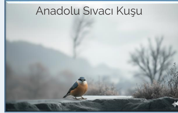
Anadolu Sivacı Kuşu

Türkiye'ye özgü, sıkça görülen ve ağaç gövdelerinde baş aşağı hareket etme becerisiyle bilinen küçük bir ötücü kuştur. Mavi-gri sırtı ve beyaz alt kısımlarıyla tanınan bu kuş, ağaç kabuklarının arasındaki böcekleri ve tohumları avlayarak beslenir. Gagaladıkları ağaçlara yuvalarını da yapan bu kuşlar, ekosistemde zararlı böcekleri temizleyerek önemli bir görev üstlenir.