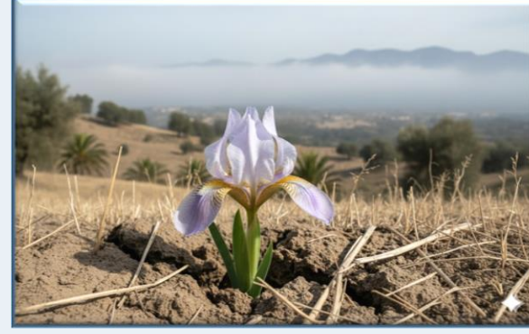
Antalya İrisi ( Iris antalyensis )