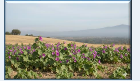
Ebe Gümece ( Malva sylvestris subsp. mauritiana )