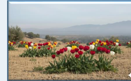
İzmir Lalesi ( Tulipa izmirensis )