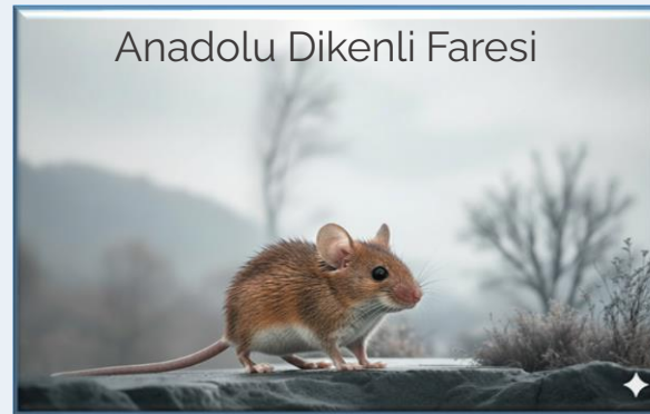
Anadolu Dikenli Faresi

Türkiye'nin güney ve güneydoğu bölgelerinde yaşayan, sırtındaki sert ve sivri dikenleriyle bilinen bir kemirgen türüdür. Geceleri aktif olan bu fareler, dikenleri sayesinde kendilerini yırtıcılardan korur. Çöl ve yarı kurak bölgelerin sıcak iklimine uyum sağlamışlardır. Nesli tehdit altında olan bu ilginç canlıdır.