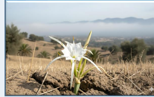
Kum Zambağı ( Pancratium Maritimum )