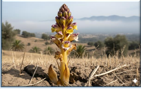
Side Canavar Otu ( Orobanche sideana )