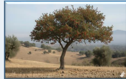
Herdemyeşil Alic ( Crataegus davisi )