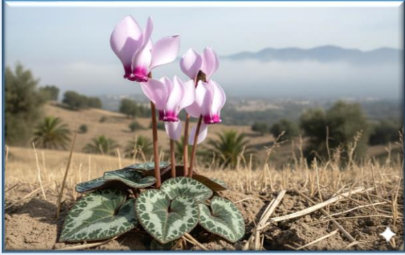
Siklamen ( Cyclamen mirabile )