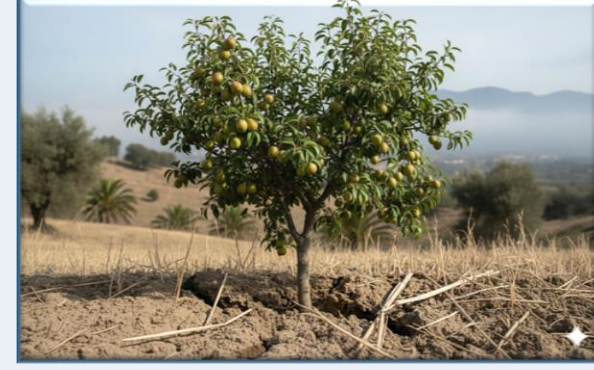
Serik Armudu ( Pyrus serikensis )