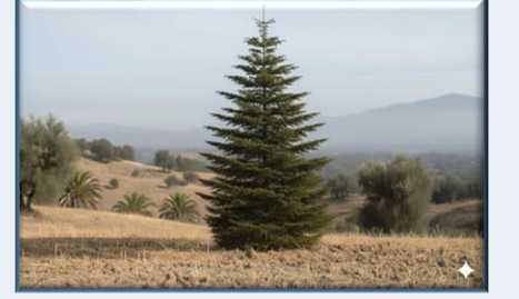
Kazdağı Göknarı ( Abies nordmanniana equi-trojani )