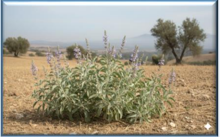
Anadolu Adıçayı ( Salvia anatolica )